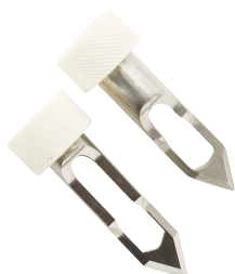
FC098 et FC099 Lames en acier inox pour électrodes pH spéciales viandes (en option)