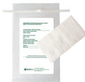
Réf. : 253819 Réf. : 253828