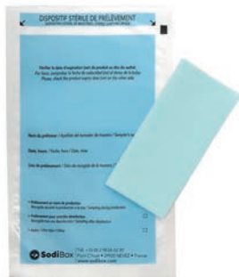
Réf. : 253866 Réf. : 253868 Réf. : 253867 Réf. : 253870 Réf. : 253871