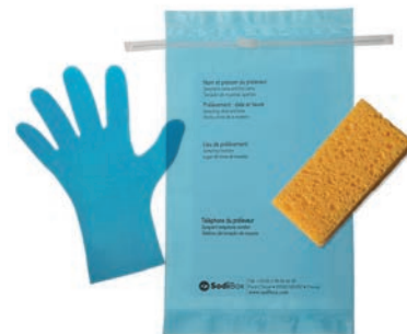
Réf. : 253859