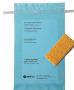
Réf. : 253860