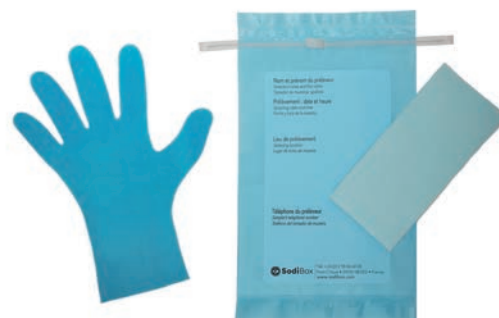
Réf. : 253827 Réf. : 253822