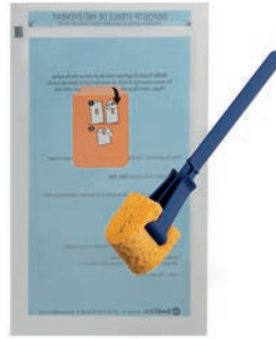
Réf. : 273763 - Réf. : 273764