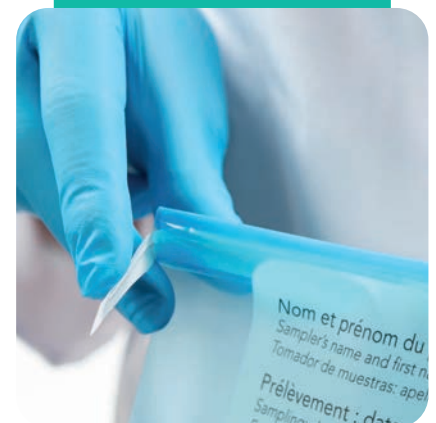
Sachet à lien de refermeture