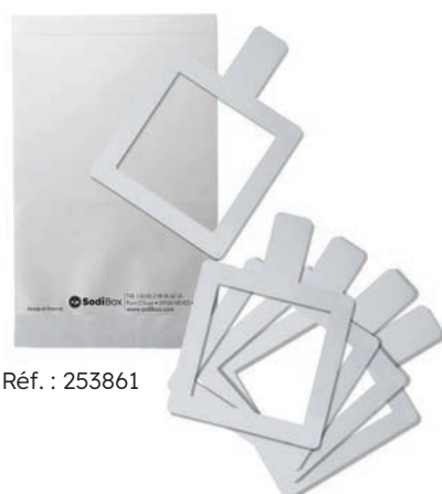
Réf. : 253861