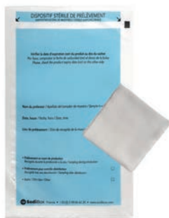
Réf. : 253874 Réf. : 253875