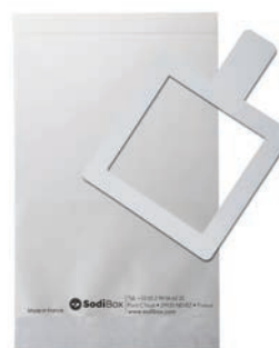
Réf. : 253862