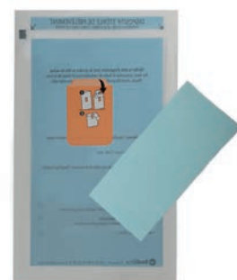
Réf. : 271738