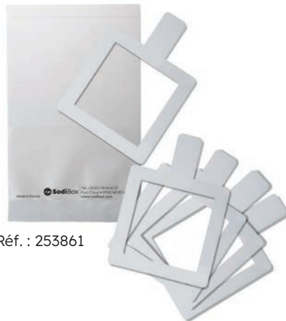
Réf. : 253861