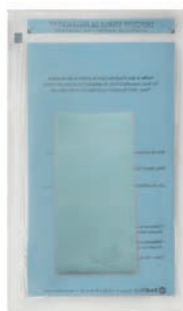
Réf. : 253865