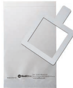
Réf. : 253862